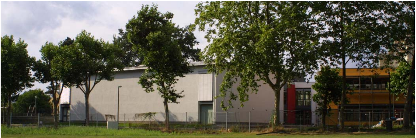
Die neue Sporthalle auf dem Gelände der Grundschule Plaidt.

Hintergrundinformationen zur neuen Sporthalle an der Grundschule in Plaidt